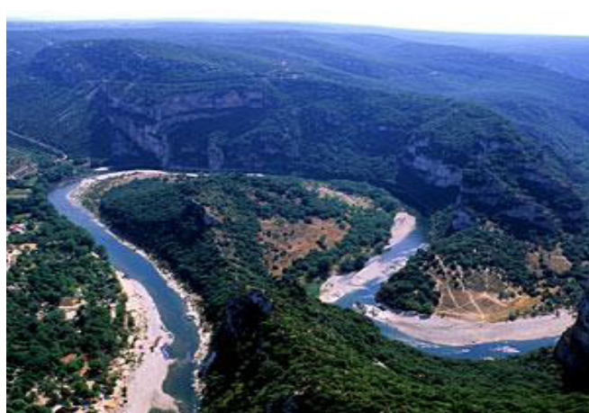
Vue aérienne des gorges de l'Ardèche.

L'Ardèche, territoire de nature et de patrimoine.