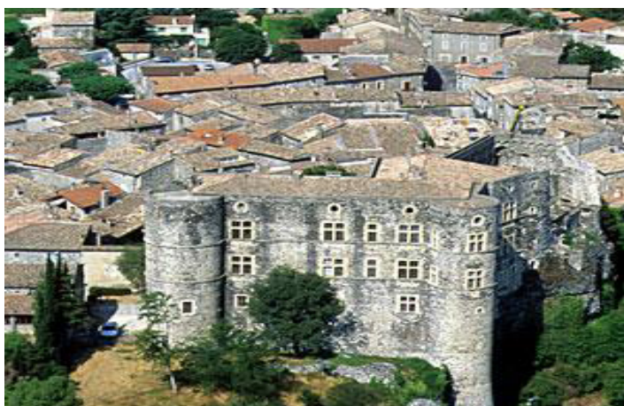
Le château et le village d'Alba la Romaine.

La terrasse du restaurant est à proximité de la piscine et des aires de jeux pour enfants.